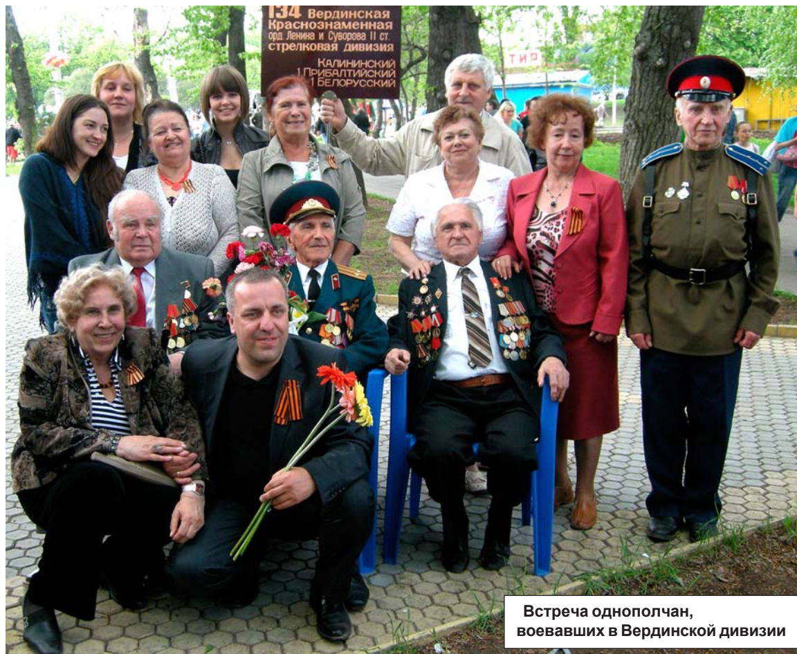
Встреча однополчан, воевавших в Вердинской дивизии